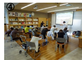
①さろんコンサート、②幼稚園児による聖誕劇の上演、③移動販売店の開店、④各種教室、その他打ち合わせなど、多様な用途で利用