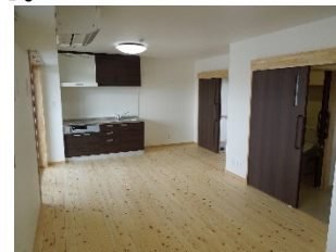
居室(Bタイプ) 床はヒノキ貼り