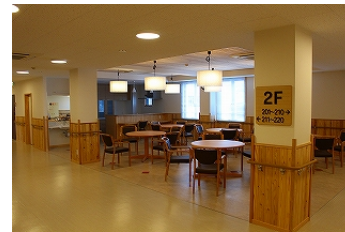
食堂・ラウンジ 腰壁には根羽スギ