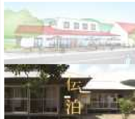
伝統的な建築物を活用した宿泊施設(交流拠点)